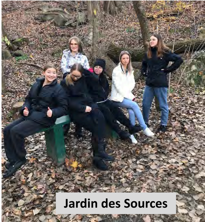
Jardin des Sources