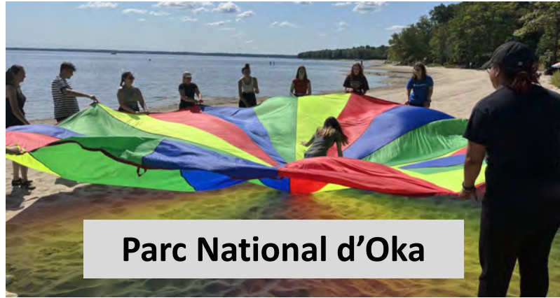
Parc National d'Oka